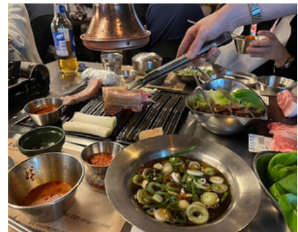
クムテジ食堂 サムギョブサル