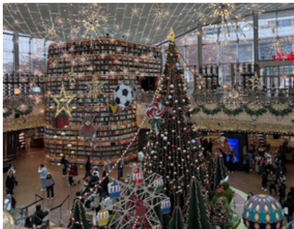
ピョルマダン図書館

美味しいものを食べ歩いたり、気になっていたお店で買い物したり、世界遺産観光や推しの聖地巡礼、チムジルバン体験など、各々自由に過ごす時間も充実していました。