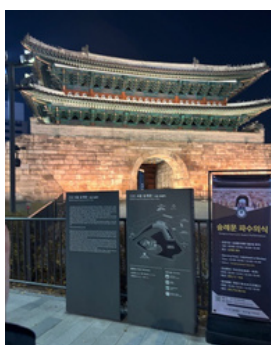
★ライトアップが幻想的です