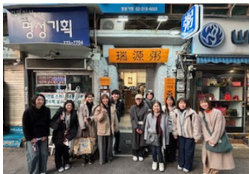
芸能人も訪れる有名店