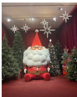
🎄ソウルの街はクリスマスの飾りで彩られていました