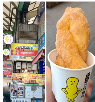
広蔵市場 クアベギ