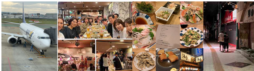
サーターアンダギーを探しに夜の街へ…

福岡空港に集まり、那覇空港に向けて出発！！ 空港到着後は、モノレールでホテルへ直行し、 荷物を置いて国際通りにある「島唄おばあの家♪海音」で沖縄の料理とお酒を堪能しました。 ライブもあり、みんなで踊って盛り上がりました。