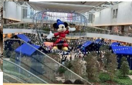
←The Hyundai Seoul の吹き抜けは緑がいっぱい。