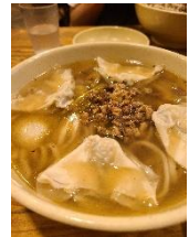
明洞餃子の定番メニュー↑

ロッテマートを漂ったり、コンサートに行ったり・・・。図書館見て、コスメを見てフェイスシート探して、ガンプラみて、お夕食は明洞餃子でいただきました。