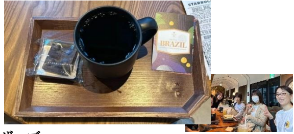
↑高級感漂ってます、スターバックス・リザーブ

スタバを出たあとは一路、おばちゃんの顔が看板の「鶏一羽（タッカンマリ）」のお店へ！！人気店で少し待ちました。その名の通り、洗面器で煮る鶏一羽。店員さんが