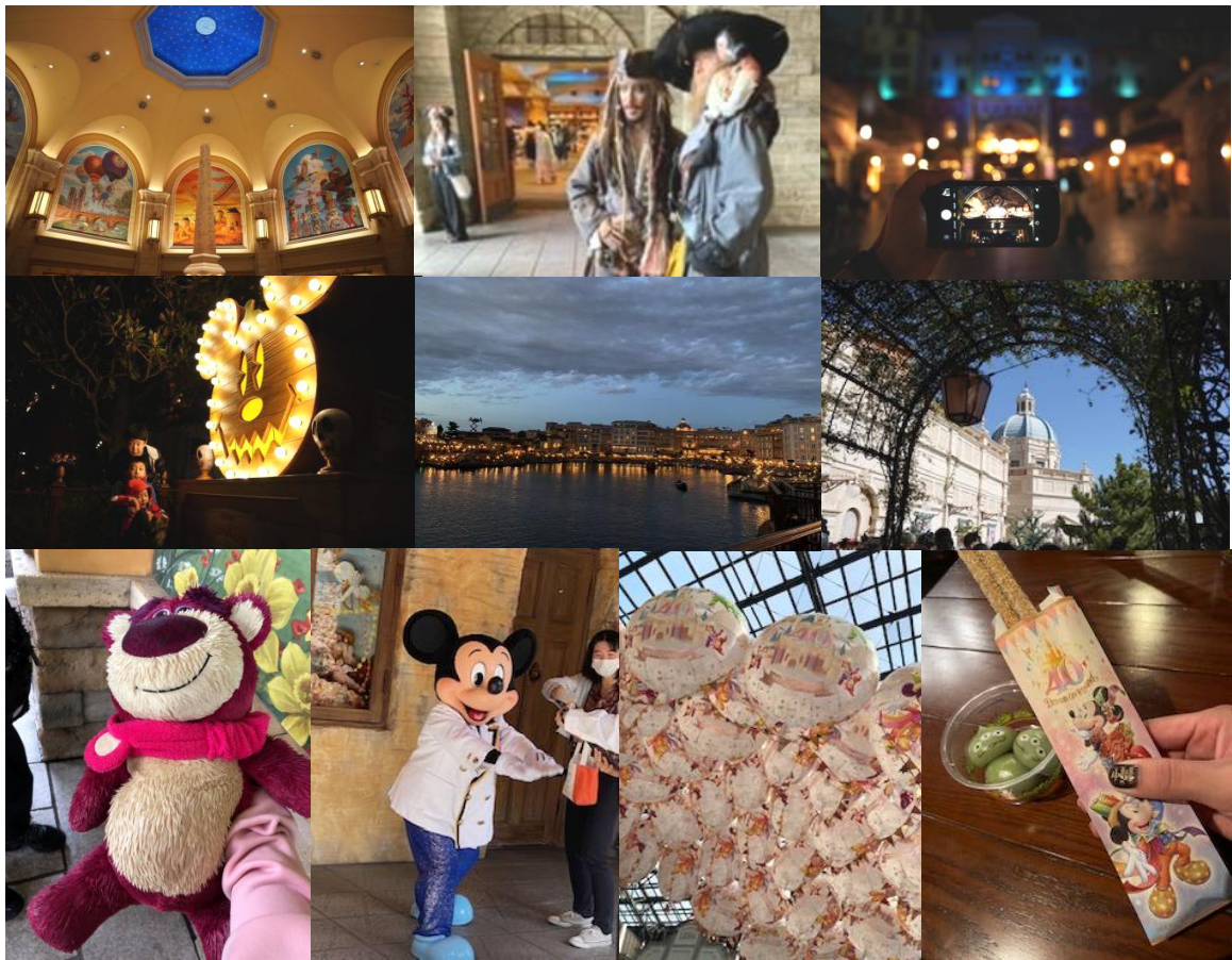
↑雨でびしょびしょになったロッツォ

最後に、企画に参加してくださった皆様、社員旅行を支援してくださったフラワース TMS 株式会社の関係者の皆様に感謝申し上げます。ありがとうございました。