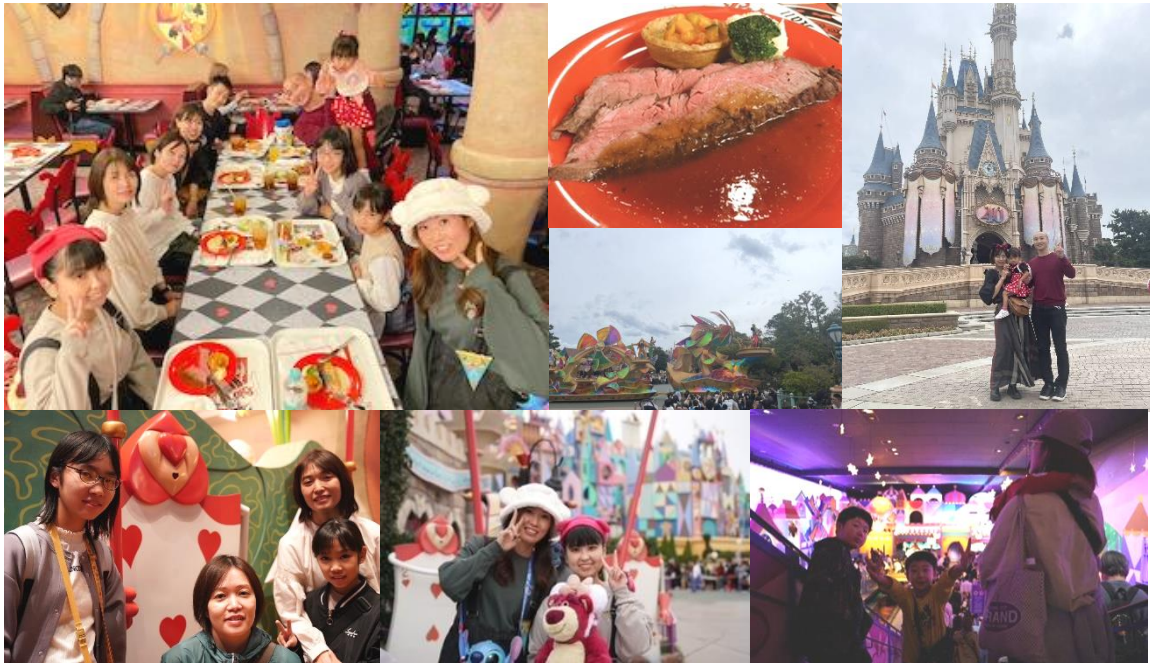
↑ 藍薬局の M 先生ご持参のカメラで撮って頂きました！（左下 2 枚）